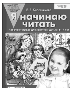
«Я начинаю читать». Рабочая тетрадь для детей 6–7 лет