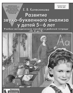
«Развитие звуко-буквенного анализа у детей 5–6 лет». Учебно-методическое пособие