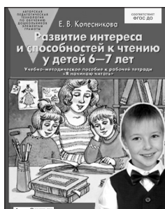
«Развитие интереса и способностей к чтению у детей 6–7 лет». Учебно-методическое пособие