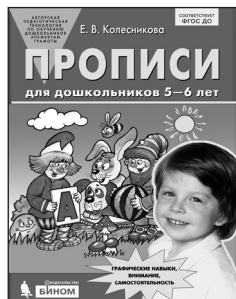
«Прописи для дошкольников 5–6 лет»