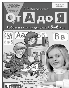
«От А до Я». Рабочая тетрадь для детей 5–6 лет